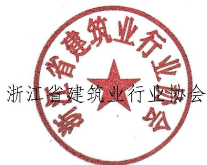
浙江省建筑业行业协会