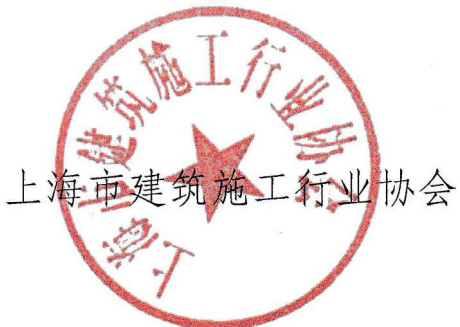
上海市建筑施工行业协会