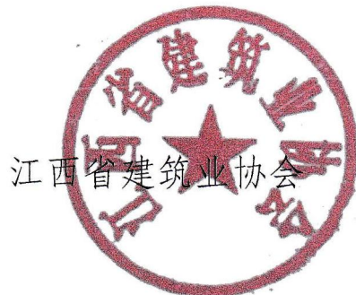
江西省建筑业协会