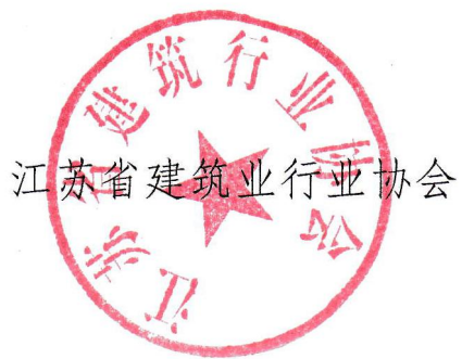
江苏省建筑业行业协会