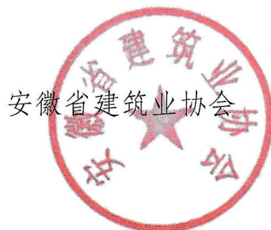
安徽省建筑业协会