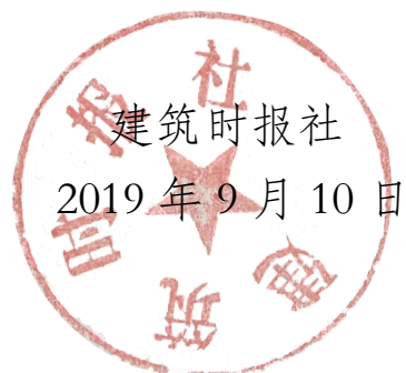
建筑时报社 2019年9月10日